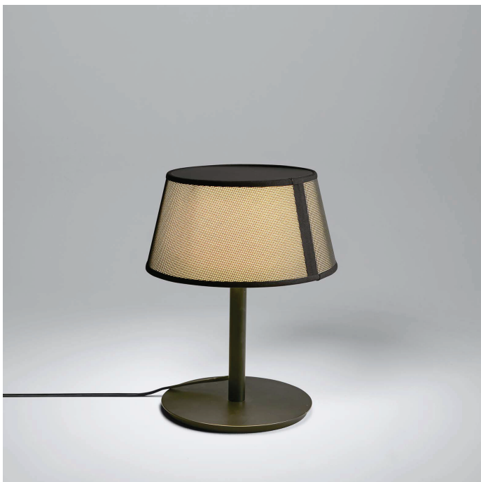
TABLE LAMP 558.32

Struttura realizzata da un'asta e da una base circolare in metallo, verniciati a polveri epossidiche, a cui si ancora il paralume rivestito in tessuto a rete nera. Structure made of a pole and a circular metal base, coated with epoxy powders, to which the lampshade is also covered with black mesh fabric.